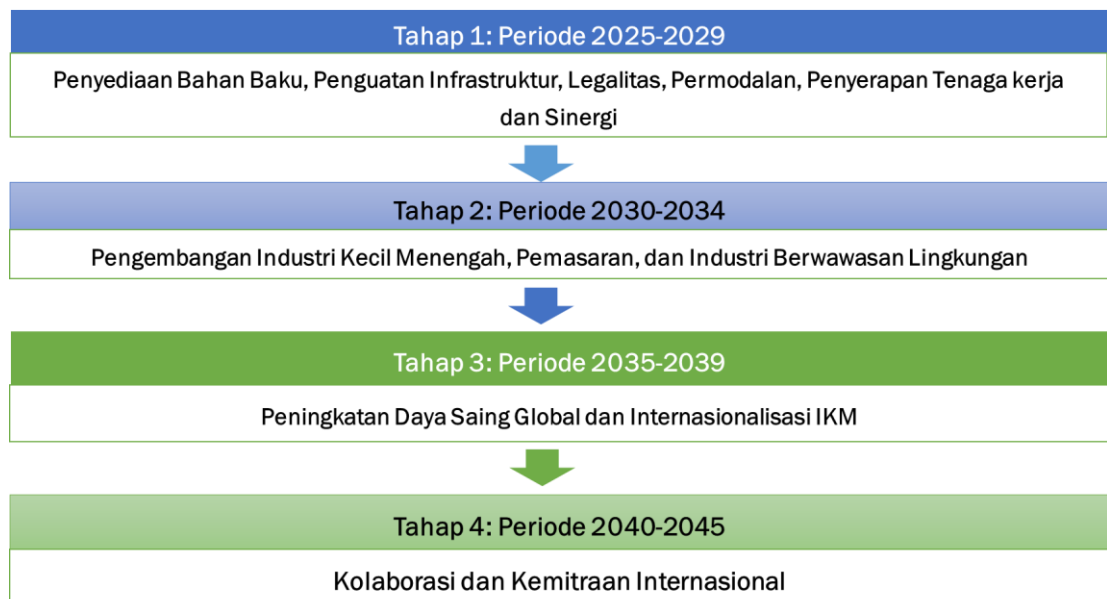
Gambar 2.2 Tahap Pembangunan