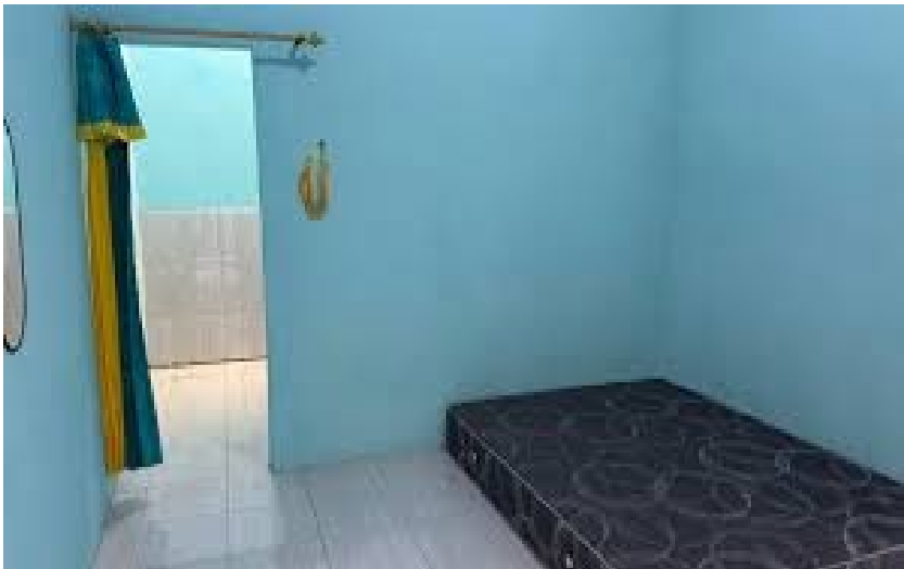
Kos Sederhana (< Rp 600rb)

Hanya sewa ruang. Tidak ada unsur "layanan". Kebutuhan dasar.