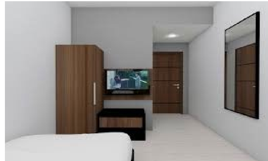
Kos Eksklusif (> Rp 600rb)

Hanya sewa ruang. Tidak ada unsur "layanan". Kebutuhan dasar.